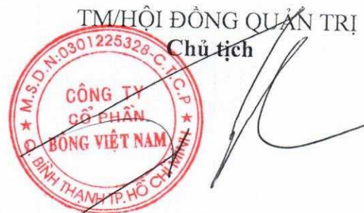
TRƯƠNG VĂN DŨNG

Điều 6: Quy chế này có hiệu lực ngay khi được Đại hội đồng cổ đông thông qua vào ngày 28 tháng 4 năm 2021.